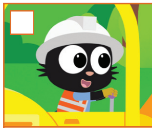
NIE PRZEGAP MIŁO PON - PT GODZ. 08:15