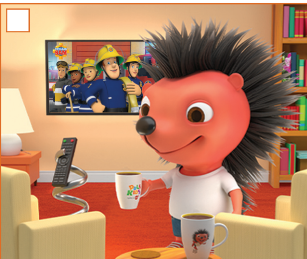
NIE PRZEGAP STRAŻAKA SAMĄ PON - PT GODZ. 07:00