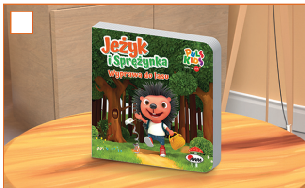
PORANNE CZYTANIE KSIĄŻECZKI