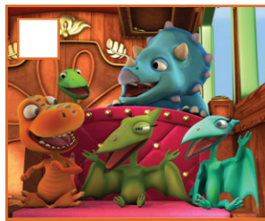
NIE PRZEGAP DINOPOCIĄGU PON - PT GODZ. 07:35