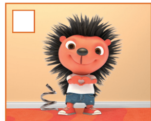
BUZIAK I PRYTULAS